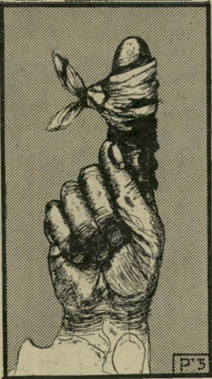
הקריקטורה של זיק "העולם הזה" 2291

בעיות האלקטוראליות שלו ויזכה לשלטון-נצח?