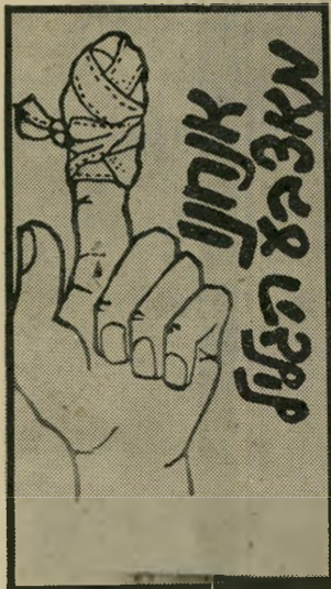
קריקטורה של גלידי אלמוני ובאותו שבוע בצפון