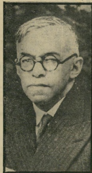
מנהיג ז'בוטינסקי לאומי?

אין אני זוכר, מתוך עיון בפיר-קי היסטוריה, את זאב ז'בוטינסקי כמנהיג לאומי גם אם נקבל את טכס האזכרה הממלכתי, הרי ש-