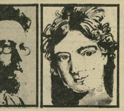
אוסטין מושפלת / צ'יבוב 29 שפ' רוח / ברונטה נשנקת

כושל; והשלישית כוללת את המכירים בכך, ששרידת היחיד והקבוצה היא בעלת משמעות שמעבר לעצם עובדת השרידה, ושהחיים הם דבר שיש ליהנות ממנו, ולא רק לשאתו. בחלק הראשון שבספר, "איתותים ל-שם שרידה — בשירות הפרט והקבוצה", מבדיל המתבר בין המילים האחרות של מושג החרדה: "העושר הלשוני של הש-פה מאפשר לנו לעבור מבהלה לאימה, מרפיון-ידיים למורא, ממכילה לתבהלה (פניקה) ומחרדה לחלילה. אולם הרגיש שכיסוד כל המילים האלו הוא הפחד...". דוגמה למונח "חרדה" מביא המתבר מתוך גיין אייר של שרלוט ברונובה: "ליכי הלם בחוקה, ראשי להם; איזני