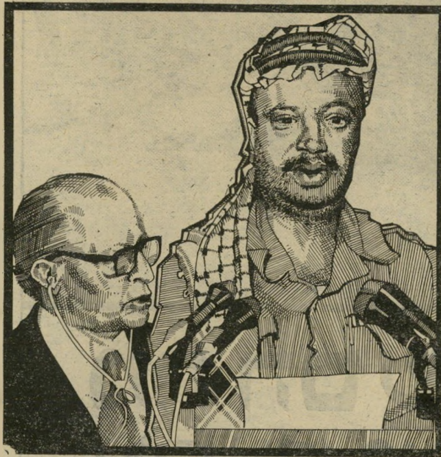
שותפות בגין-עראפאת תשלום חובות

אחרי הבחירות החזיר בגין לי עראפאת טובה-תחת-טובה. אחרי שבועות ארוכים של הפוגה תקפו לפתע מטוסי חיל-האוויר את אנשי עראפאת. הללו השיבו באש על ישוביגו, והתפתחה מלחמה שב-סיומה הוכר עראפאת ככל העולם