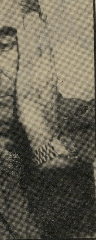
גשלה ממלנדאו האמנתו ככתב הר צבאי, במשך חצי שנה.

לא ידעתי לנדאו על אריק שרון, אז מפקד חטיבת-שיריון במילואים, שהיה באותה תקופה באחת מתקר פות-השפל שלו, לנדאו הפך מאז כן-בית בבית שרון.