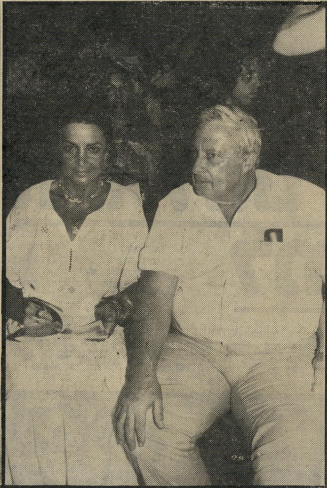
בשורה הראשונה ליד הרמטכ"ל, רפאל איתן, שנאם בתחילת הערב נראה שהמופע לא מצא חן בעיניהם, כי הם עזבו את האולם בהפסקה. בניגוד לכניסתם, שעוררה סקרנות בקהל, הם יצאו בהחבא