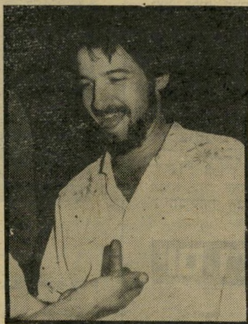
ניר חכדיקי נאמן רק לאחת

ניר חכדיקי, מכירים? אני בטוחה שכן. אם לא, אוכיר לכם. ניר הכלילי התגלה בתחנה הצבאית גל-צה"ל, עוד כשהיה חייל. הוא ערך תוכניות מוסיקליות, ובין השאר, ערך גם את מיצעד הפזמונים העברי.