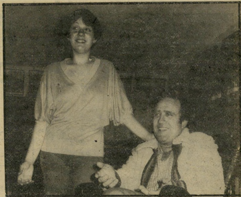
יהורם גאון ואורנה גאון ניתוח קיסרי

לבת קראו הילה, והיא נולדה בבית חולים מישגב-לדן בירושלים. הלידה אמי גם לא היתה מן הקלות, אך לאם ולבת, ברוך השם, שלום, ואני שומעת את פעמוני החסידה מצלצלים בקול אדיר. שיהיה לכם במזל טוב גאונים, במזל טוב.