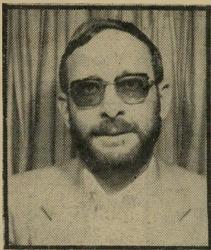
מציל שמעון 100%

שדיקטטורה זה לא נורא ("העולם הזה", מימין תי- פתח הרעה, 2284).