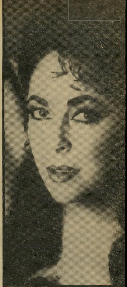
לייז טיילור, לא יכולה בלי גבר.

האנקוויירר יודע לספר כי לייז טיילור ומפיק הצגות התיאטרון זאב בופמן מגה־ לים רומן סוער בניו־יורק, בזמן שבני־ זוגם החוקיים אינם נמצאים בסביבה. ה־ כוכבת בת ה־49 המפיק בן ה־50 אינם נפרדים זה מזה אף לרגע, והם נראים מחזיקים ידיים במיסעדות אינטימיות. ה־ שניים מבלים שעות ארוכות בבית־המלון של לייז. הם מקפידים לא להתגורר יח־ דיו, אך כתבי הטיימס אנקוויירר תפסו את בופמן מגיע למלון באחת וחצי בלי־