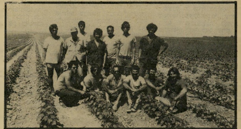
צוות השלחין שזי קבוצת נחל-עוז 600 ק"ג כותנה, 500 ק"ג חיטה, 1300 ק"ג סלק, סוכר לדונם