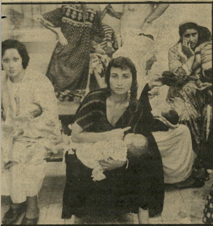
תושבי קריית שמונה במוקדטים אחרי שהעשן יתנדף, הכל יישאר אותו הדבר

מוטלת בספק חמור. במוקד רה הטוב ביותר זהו טרור נגד טרור, ובמיקרה הרע ביותר זוהי ענישה קוזק טיכית של ציבור שאין לו כל יכולת לשנות את המצב.