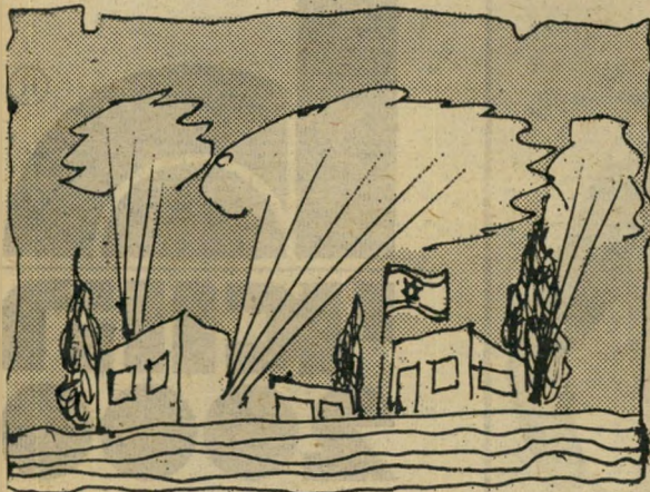
ובטחון המדינה נשמר