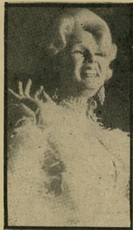
ריינודד: שדום צ'ארלי יום שישי, שעה 9.15

פרט קולנועי: היה שדום צ'ארלי (9:15) — שידור בצבע, מדבר אנגלית: לית: טוני קרטיס, דבי ריינולדס ואלן בורסטיין משר- תתפים בסרטו של וינסנט מינאלי. הסרט מבוסס על קור מדיה קופתית מצליחה, המסי