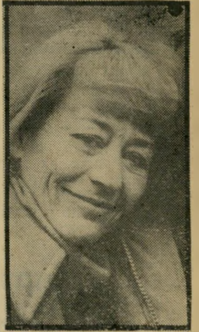
ג'וראדו: ד"ר גיאנאנ יום רביעי, שעה 10.03

סידרה לילדים: עולמו של ווט דיפני (5:30) — שידור בצבע , מדבר אנגלית: הסרט מיבחן האומץ מספר על נער שחי עם שיבטו על אל בודד, ושפחד מהים. עד שגילה אור מִזֶּלֶב הראוי לציון. מדעי-בידיוני: חדרי צי החלל (6:15) — שידור