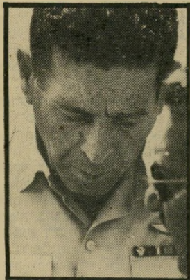
טל: כסופה מרכבותיהם יום שלישי, שעה 9.30

בידור: פיז סיי מון (10:00) — שידור כי צבע, מדבר ומזמר אנגלית: לית: הזמר, פול סיימון, אחד הזמרים הנודעים באר- צותי-הברית. הקים בשנת 1964 ביחד עם ארט גורפנקל את הצמד „סיימון וגורפנקל”. סידרת-מתח: פטון (10:55) — שידור בצבע, מדבר אנגלית: הפרק „שפיות אטומית” מביא אל האקרן שוב את הבלש-סופר, שאותו מגלם דניס ויבר.