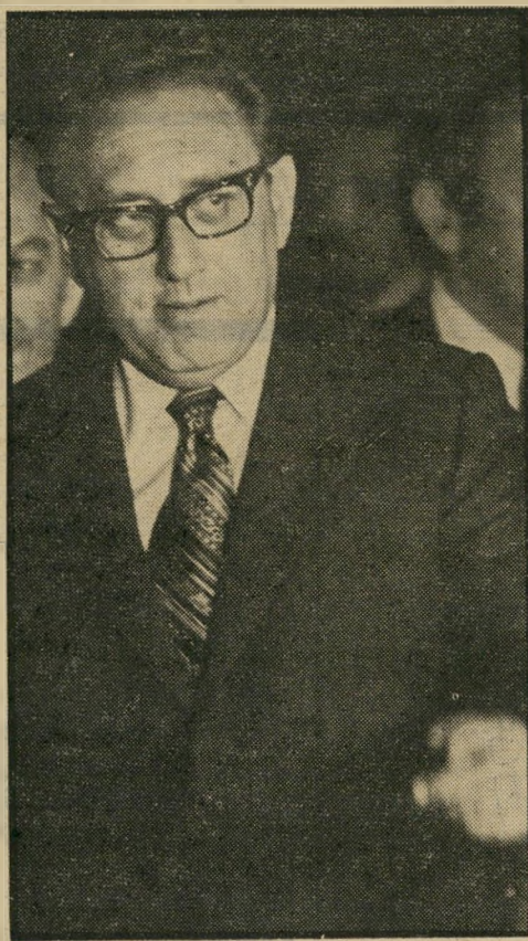
הנרי קיסינג'ר פאראנואיד עם אויבים

ליפול על כפות רגליו. השבוע חתם קיסינג'ר על חוזה עם הטיימס הלונדוני, הוא יתוב טור של 800 מילים, ויקבל עבור המאמץ 300 אלף דולר לשנה!