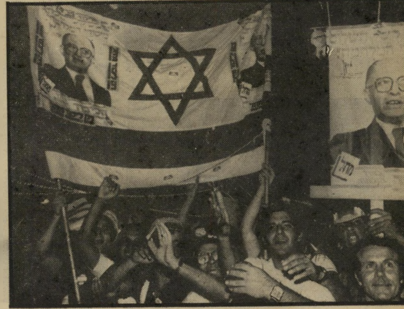
האסיפה האחרונה של הליכוד בתל-אביב למי הועילו המיליארדים?