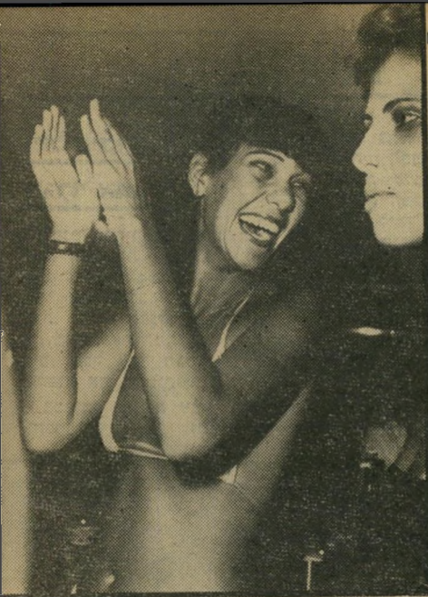
להיות שמחה ועליזה בכל מיקרה החליטה המועמדת שכבשה את לב השופטים בחיזוק הנלבב והטוחף.