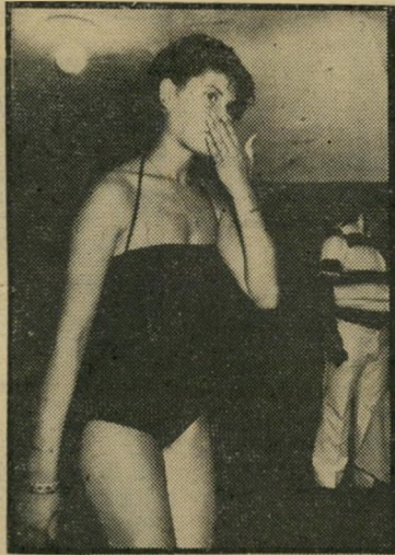
ערביה מחיפה היא בעלת הפנים היפות והגוף החטוב. הצעירה הערבייה סיפרה כי היא משתפת בתחרות ברשותם של הוריה.