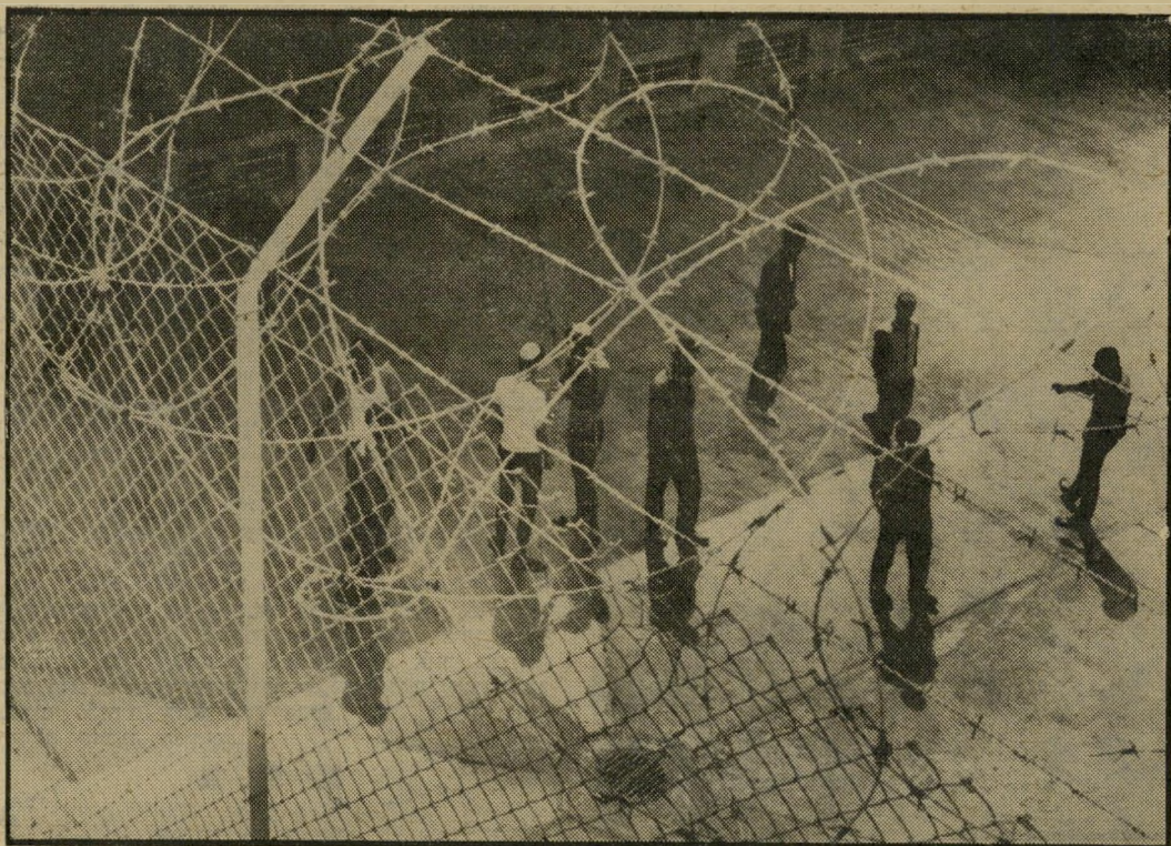
"תוך כדי הדיבור הזה נשמעו צעקות מצד סמל, ומייד לאחר מכן אועקה."

אנחנו לא מבינים בדיוק מה הולך, ואת סיבת דקירתם