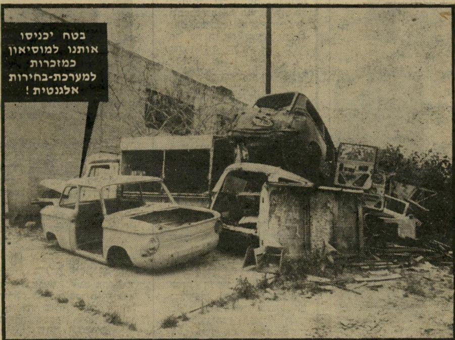
מכוניות במיגרש גרוטאות