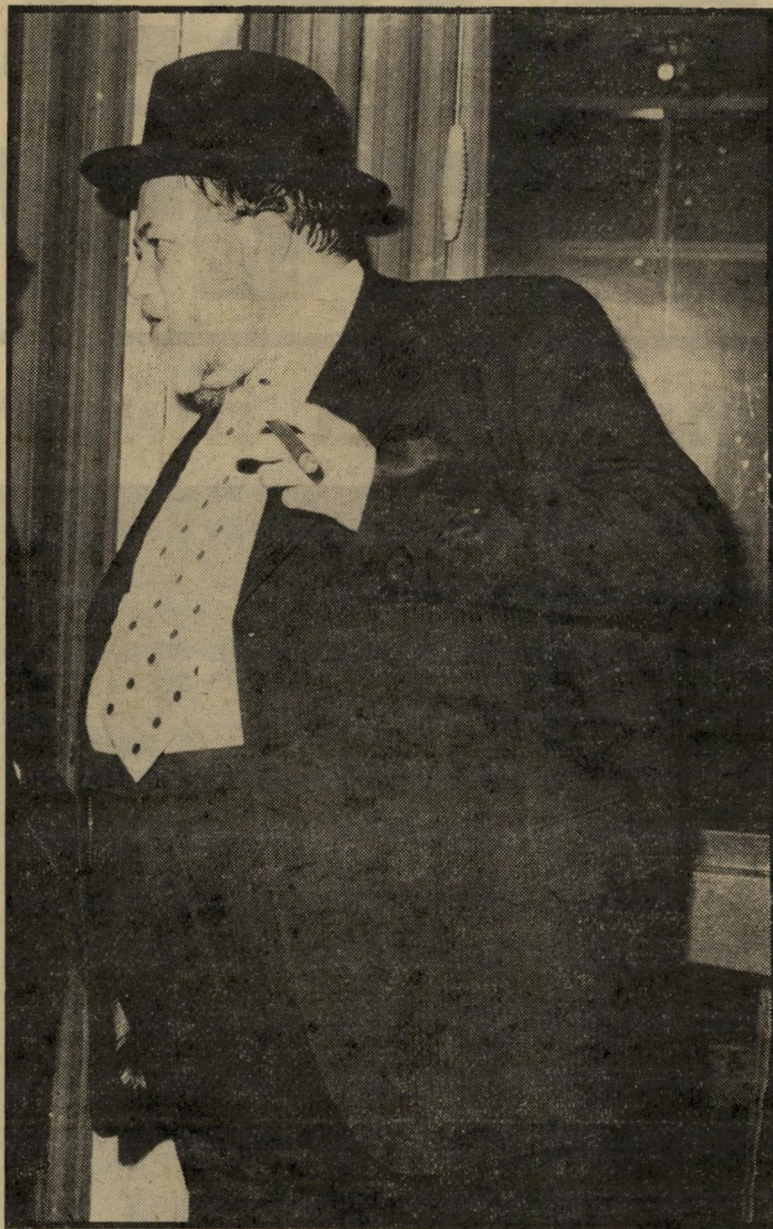
אברהם שפירא טוב לעושר

אחר כך את תמיכת הישיש בהם ולהציג עליידי כך את אביר צירא כשקרן. ואמנם, עסקנים זריזים במטה תמ"י מיהרו לפרסם את דבר תמיכת באבא סאלי ברשימתם. אגודת ישראל מיהרה להגיב, פירסמה את מיכתבו של באבא סאלי ה"קורא לתמוך בהם.