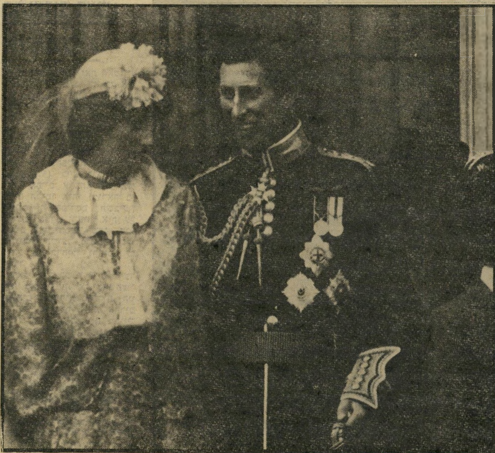
הנסיך צ'ארלס והליידי דיאנה במירפסת ארמון-באקינגהם

גוסטב מלך שוודיה, ורעייתו סילביה משתדלים להשתחרר מגיווגי-מלכות כל אימת שהדבר אפשרי. בתמונה זו נראים השניים בכגדי-ערב אופנתיים, כשהם מבלים לילה עליו בדיסקוטק במנטה קארלו, בלי שומרי-ראש ומנהלי טכס. הזוג השוודי יפה-התואר נהג להשתתף מדי שנה בחגיגות "גראנד פרי", מירוץ-המכוניות הראוותני ביותר בעולם. הם ידועים כזוג האורחים העליו ביותר בארמונו של הנסיכה גרייס. היתה זו סילביה, שלפני זמן קצר עוררה עליו את חמתם של שומרי הפרוטוקול, כשהתאפרה בפומבי.