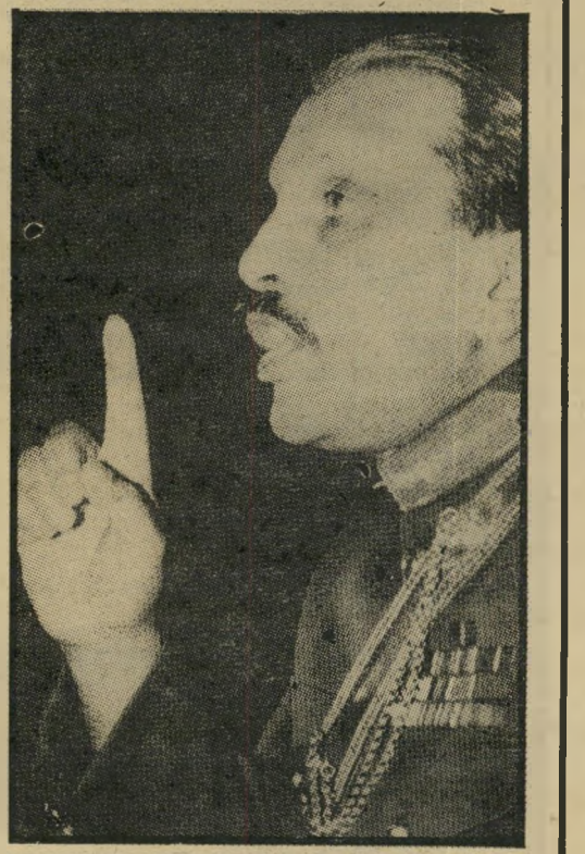
נשיא פקיסתאן זיא א-לי-חאק לקראת הבחירות לכנסת ה־11?

נאמו של נשיא עיראק, סאדאם חוסיין, מצביע על נחישות החלטה ערבית להשיג פצצה בכל מחיר, ולא דווקא בדרך של ייצור מקומי. אם בחר מנחה בגין בדרך של אי-שפיות כשיטה מדינית, המסקנות ברורות. המטרה היא עתה פקיסתאן.