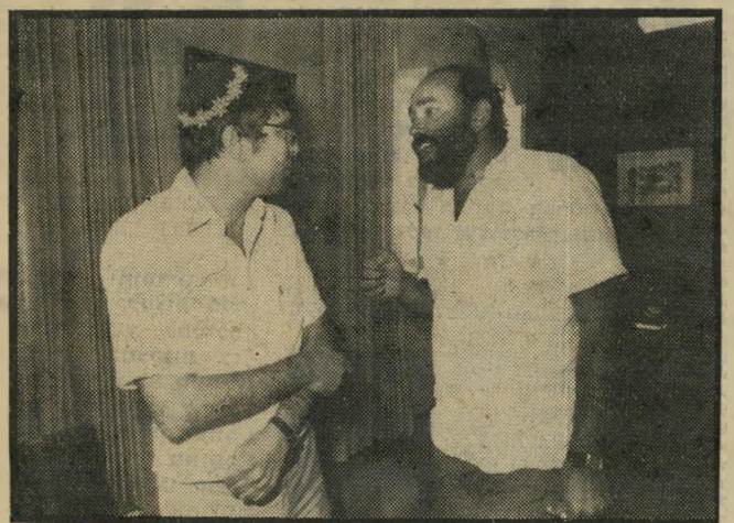
כתב ינאי ושר אבורחצירא אנטי-זיגל

עקב ההוזלות של תשרי האוצר 15% הנחה על רחוקים של