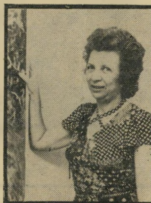
ציירת כת-אורן מהיטבח לפמיניזם