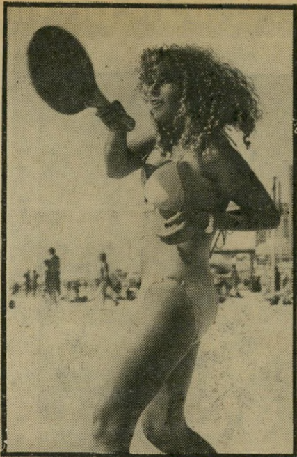
דתי'ת שולי זיאת, בת למישפחה מסורתית, מעדיפה את ה'ביקיני הוורוד על פני בגדי הים השלם.