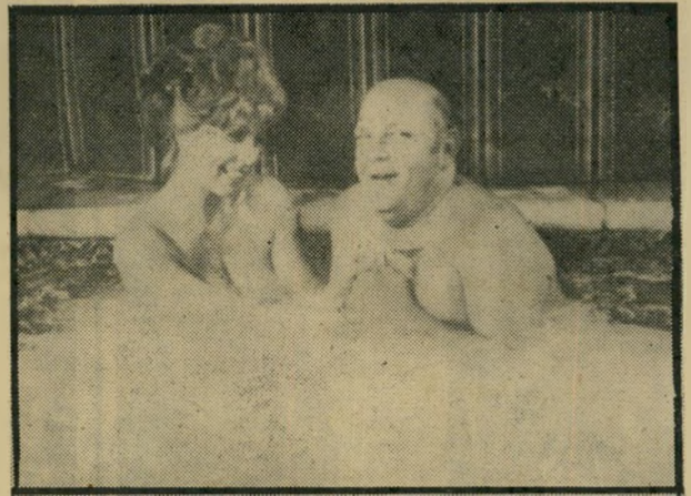
סטיבנס: פתוחה להצעות יום שישי, שעה 10.15

● תעמוזה: שידורי המפלגות לקראת הבחירות לכנסת העשירית