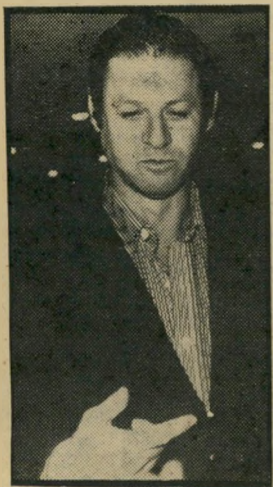
יבין: בחירות '81 יום-שלישי, 9.30 לתוך הלילה