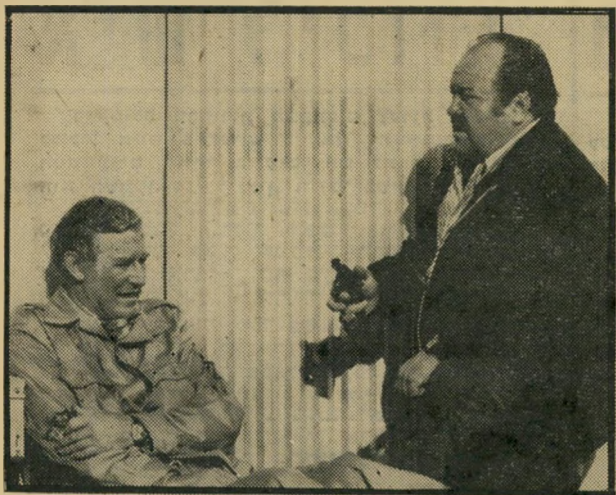
קונרד: קאנון יום שני, שעה 10.45

● בחירות 81 (9:30) — שחור לבן. מישדר מיוחד של מחלקת-החדשות על סי-קור הבחירות לכנסת העשי-רית.