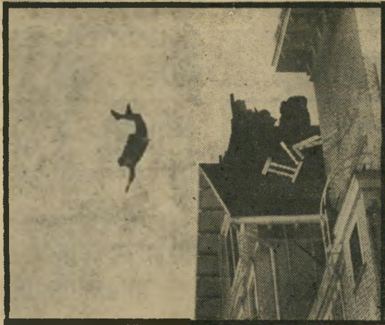
כפיל קופץ מגג: דמיון ומציאות

קודם כל, יש עליה מקובלת: צעיר הנמלט מן המיש-טרה, מוצא מיפלט בתוך צוות-הסרטה, המכין בעיירה קטנה סרט על מילחמת העולם הראשונה, המנסה לה-זים את מיתוס הגבורה. מאחרי העלילה הזאת קיים רובד שני: כל מה שקורה לגיבור זה, במשך ההסרטה, הוא תערובת מוזרה של דימוון ומציאות, כאשר בכל פעם שנדמה לו כאילו הוא יודע מה קורה, הוא ניצב בפני מחזה תעתועים, בכל פעם שנדמה כאילו המציאות אינה יכולה להיות כה משונה, מסתבר שהכל בכל-יזאת אמיתי. מאחרי זה יש רובד שלישי, זה שמדבר על הקולנוע כאמצעי ביטוי. כאן נדמה כאילו הבמאי, ריצ'ארד ראש, פשוט בא לאמת את הגדרתו המפורסמת של אורסון וולס: "הקולנוע אינו אלא שרשרת של חלומות." ועוד רובד אחד, שבו מדובר על התחייבות האמן ליצירה שהוא יוצר. אומר במאי הסרט שכל אמצעי כשר בידיו כדי להשיג את מבוקשו: "איש לא יעז לחתוך את