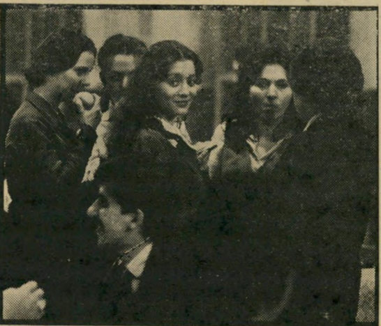
ורוניקה פארו: חן וטבעיות

אולם, אם מתבוננים היטב במה שמתרחש על המסך, אפשר לראות מייד שיש כאן הרבה יותר: החל מן הצניעה הראשונה, העוסקת בשחיתות בתוך בית-החולים שבו מועסקת הגיבורה, והיחס העויין כל-פיה, כאשר היא מגלה שחיתות זו, ודרך הביורוקרטיה האווילית המאמינת את מהלכי-הקורס וחוסר-הכשרון שלהם להבין לרוח חניכים, ועד להפגנת הביקורת-העצ-