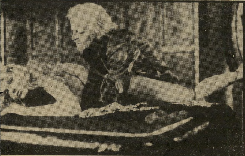
קדאום קינסקי ואריאז דומבז כ"פירות התאוה" אהבה ללא מיצרים

אביה (בכלל יש בסרט התעסקות חזרת ונשנית בדמות האב הכוזב). שלישיית חיוור רת עד מוות, בעיקבות מחלת שחפת, וכן הלאה. הדרכים השונות שבהן מספקות גברות אלה את רצון לקוחותיהן מאפשר, כמובן, לטראיאמה לא רק לעמוד על זרועות המין האנושי, אלא גם לספק את תאוות ההצצה של הסקרנים למיניהם. להט הנעורים. התקופה שבה מתרחשת העלילה נבחרה כדי לשלב בתוך הסיפור את תחילת המהומות של שני העיר נגד הורים והמנצלים, כאשר אחד הקברים צנים הצעירים מתאהב באו, ומצליח, לא-חר מאמצים מרובים (מאחר שאין הכסף נתון בכיסו), לתנות עימה אהבים. החן, התשוקה הטהורה ולהט הנעורים שקושר את שניים אלה (או בסרט זה היא נערה בשנות העשרה) מהווה את מפתח הכפולה של הלורד סטיבן. מצד אחד, מסתבר לו כי זהו אספקט אחד של אהבה שנבצר ממנו, אחרי שהתפלשותו בכל סוגי תאוות הבשרים האפשריים הניסה ממנו כל צל של תום, ומצד שני, כאשר את מקומו תופס פרוליטר מן השורה, סופו של דבר, הוא אכן רוצח את הנער הצעיר, אבל