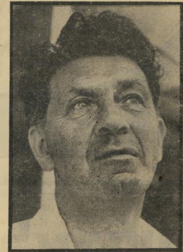
כותבי-מיכתבים שריק מזויף

שמישהו כותב מיכתב בשמו של מישהו אחר, בחתימה מזויפת. אך המיקרה הזו הוא חמור במיוחד, ואולי יש לראותו על רקע מערכת-הבחירות המחריפה והולכת.