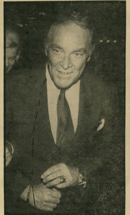
שרי-החוץ הייג מועמד להדחה?

הערה סרקסטית זו, ששובצה במאמר-מערכת של העיתון הרדיקלי של ניו-יורק, ויליג' ווייס, משקפת היטב את מצבו העכשווי של שרי-החוץ של ארצות-הברית. הגנרל לשעבר, אחת הדמויות האפלות ביותר בצוות של הנשיא לשעבר ריצ'ארד ניקסון, שנאשם בפשעי-מלחמה