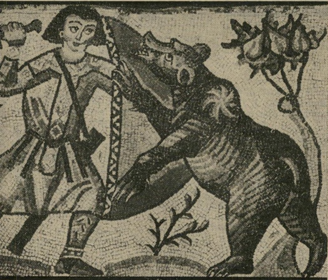
"זוחם נאבק בדוב" מתוך פסיפס "כיסופים" חלק מכנסייה ביזנטית

דמויות איקונוגרפיות טיפוסיות. הצגת הריצפה המיוחדת לקהל הרחב היא אירוע יוצא-דופן. בד בבד עם הצגת ריצפת הפסיפס מכיסופים, מוצגת בחלקו ה-שני של אותו האולם, תערוכה ה-פותחת אשנב אל עולם הארכיאולוגיה. התערוכה מסבירה ומתארת בצורה מוחשית מהי רפאות חרסים, כיצד מלקטים את שברי החרסים באחרים ואיך הופכים את תם לכלים משוחזרים. התערוכה עשויה בצורה דידקטית, אסתטית מאוד ומרחיבה את הדעת.