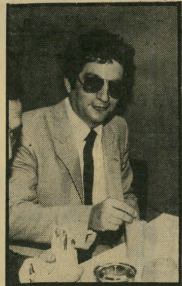
פרקליט ליבאי יום נוא