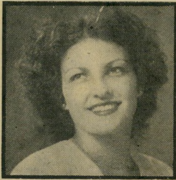
לייא, אז וכיום יפהפיות העיר

לאוהבים, שיעשה הכל כדי שילדיה, משני צידי הגבול, לא ייפגשו בשדה הקרב. המחשבה על כך הפכה לה לסיטוס. היא ידעה שלמרות שהחליטה לוותר על בעלה, לא ויתרה בכך על ילדיה, אלא מחוטר ברירה. כל השנים דאגה להם, נשאה אותם בליבה, במחשבותיה ובחלומותיה. אחרי כעשר שנים במחיצת בעלה השני, אחמד, התעייפה גם מנישואין אלה. הגביר, לדעתה, מתייחסים לנשים כאל רכוש בלבד. וזה המריד אותה. היא התגרשה מאחמד, ויתרה על דמי-מוננות, לקחה עימה את ילדיה ופתחה דף חדש בחייה. הפעם היתה חופשית. יעליליא התחילה לעבוד במפעל תפירה, והפכה תוך זמן קצר למנהלת-עבודה אהודה ומצליחה. היא החליטה להקדיש את חייה לעצמה ולכל ילדיה, גם לאותם שמעבר לגבול. היא חיכתה לשעת כושר, פירנסה וחינכה את ילדיה בעמל רב, ללא כל עזרה. ליליא-יעל לא חיפשה נישואין בפעם השלישית. פעמיים הספיקו לה. ילדיה הישראלים ידעו סבל רב. אביהם נשא לו אשה חדשה, שלא שמחה לגדלם בביתה. עד גיל 12 התגלגלו הילדים במוסדות וכשבגרו החלו לחפש את האמא האמיתית שלהם. הם לא נחו ולא שקטו, ולאחר חיפושים מייגעים, במשך שנים ארוכות, יצר הבן הבכור קשר עם אימו והחל להתכתב איתה, השלום בין ישראל ומצריים נראה אז כחלום באספמיה. המהפך הגדול התחולל עם בואו של נשיא מצריים אנור אל-יסאדאת לירושלים. (המשך בעמוד 54)