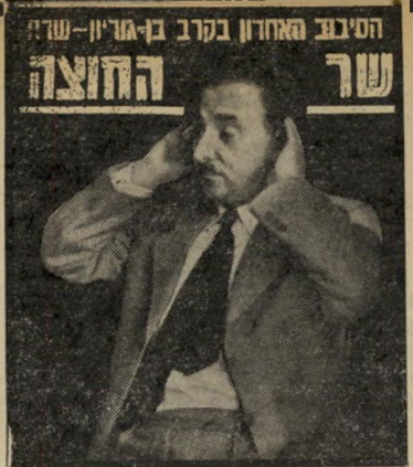
"העולם הזה" 974 תאריך: 14.6.1956