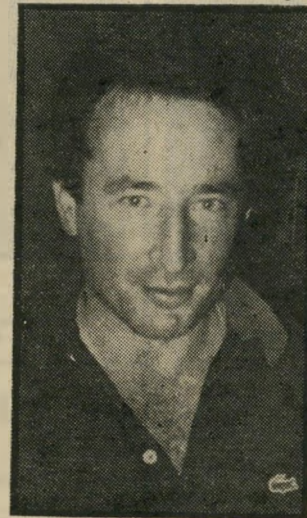
פרקליט וינשטיין — אנושי וסוציאלי

אל לוטן, שזוכה על־ידו השבוע מכל אשמה. הנאשם לא עבר עבירה כלשהי ולא סטה באופן כלשהו מדרך ה־ ישר במגעיו עם רשויות הקלי־ טה, אמר השופט. „אני מביט צער רב על שהנאשם מצא את עצמו על ספסל הנאשמים והואשם בעבירות שיש עימן קלון. קשה יהיה להשיב לו את הפיצוי המגיע לו על עגמת הנפש ועינוי־הדין שעמד בהן בשנים האחרונות.“