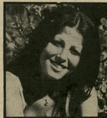
עקרת-בית הימפר לא פריחה