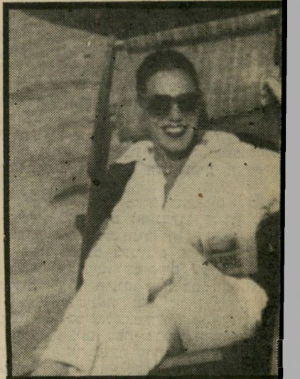
פקידה מיכמין לא פריחה