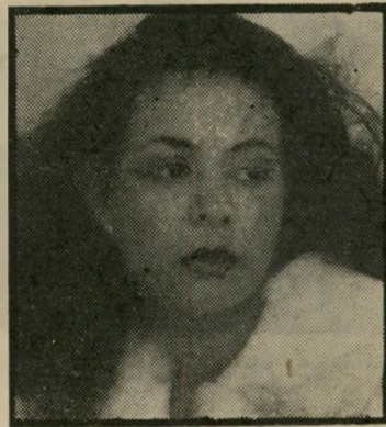
דוגמנית גלזן לא פריחה