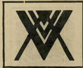
סמל תנועת עצמאות

באיטליה השתמשו פוליטיקאים ואנשי-עסקים מן הימין במסווה ש- סיפק להם תא של הבונים החופ- שיים, והממשלה פלה בעיקבות הגילוי. גם אני כמעט נפלת כי אשר גיליתי את הדימיון המפתיע