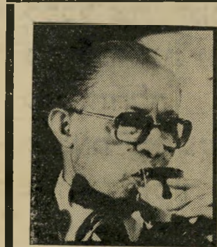
פניעה בחריפות חיים ארוכים

דימיון מפתיע בין סימלו של אירגון בינלאומי חשאי