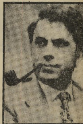
קורבן ח'דר כימטס כומר

"מישהו לא אהב, כנראה, את דרך שבה קשר נעים קשרים הדור-ים עם מדינות-אירופה, ובמיוחד עם ארצות השוק האירופי המשו-ף, אמר בן-דודו של נעים, כומר-איוור ג'נין. "הרי ידוע שעד לפני זמן לא-רוב נטו מדינות-אירופה ל-ובת ישראל. והנה חל שינוי וזו-לגל התהפך. לא עוד תמיכה בל-ימיסטיגית. לא עוד ההארות-אהר-ת, אלא הסתייגות, קריאה להכרה וזכויות העם הפלסטיני. נסיגה-השטחים הכבושים. איזה ספק כי דיומתו של נעים הייתה מכרעה, יצירת הלך-רוח חדש זה. מישהו