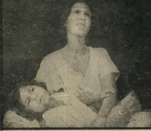
שער כפר קאסם

שלושה שערים שהתגברו על הצנזורה. הצנזור ניסה לטכס או למנוע את הפירסום, אך במקרים הללו, כמו ברבים אחרים — ללא הועיל.