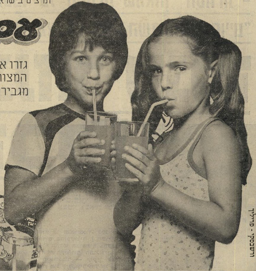
ורישבסקי - פרליר