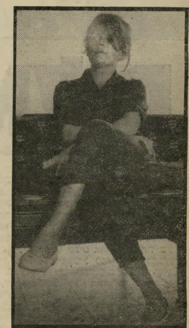
סופרת איתן רעה

ובחלוקת הארץ בין שני העמים, הישראלי והפלסטיני.