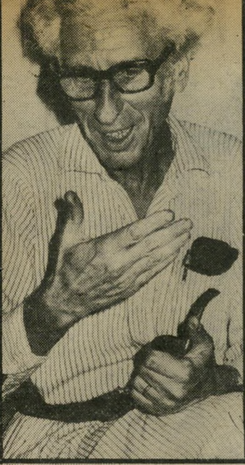
רקף הלינגר לא כשווייץ ישראל