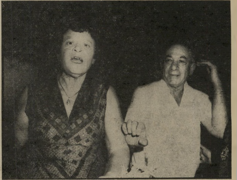
עם אשתו — צעקות ואימים

היה הורביץ לתקוף את הגורם האינפי-לציוני של הכלכלה הישראלית — תקציב הביטחון. שהרי תקציב זה, פלוס החזרי-חובות על חשבון תקציב-ביטחון משנים קודמות, פלוס תקציבי אדי-הוק ממישרדים ממשלתיים למשימות בשטחים הכבושים — החל מקניית קרקעות ועד הקמת התנח-לויות — עולים למשק כשני-שלישים מ"תקציב המדינה. זהו מצב בלתי נסבל, המוליד בשיטתיות אינפלציה גבוהה. כמות המועסקים בתחום הביטחון על גווניו ה"שונים, מגיעה לכדי 25 אחוזים מכלל המועסקים במשק; ואלה אינם מייצרים דבר, אך צורכים כמו כל אחד אחר. כלומר, על כל שלושה המייצרים דבר-מה, יש ארבעה צרכנים. ברור שלא-אינפלציה ב"ש" ראל יש סיבות נוספות, שהן מנת חלקו של כל העולם המערבי, אך אי-אפשר להתעלם מהמרכיב הייחודי הגורם לאי-פלציה גבוהה בישראל — תקציב הביט-