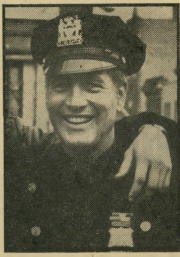
ניומן בתפקוד השוטרי מורפי לוקחים לו את הנעליים