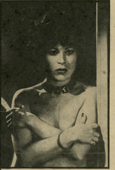
היצאנית קה (ריטה רוסק) קצר במוח האדם

חדשה שרקמתי. סצינות החלו לקבל צורה. עכשיו חיי מאריונטות הפך להיות עובדה קיימת. במילים אלה נפתחת ההקדמה של אינג-מר ברגמן לחסרית סירטו החדש ביותר. מחיי מאריונטות. שיוצג בקרוב בישראל. בדרך זו הוא קושר את הסרט למה שעשה קודם לכן, ועוסק בפעם נוספת בשטח המסריד אותו לאחרונה בצורה עיקבית. כי לסרט החדש אפשר היה לקרוא, בלי לחטוא לאמת, „עוד סצינות מחיי נישוא-אין“. נדמה, שלצורך זה הפשיט הבמאי השוודי עוד יותר את סיגנונו, הפך אותו קאמרי עד כדי קיצוניות, כאשר הוא אינו מש אף לרגע מן הנושא המרכזי. מבחינה חזותית, זה יכול להזכיר סרט