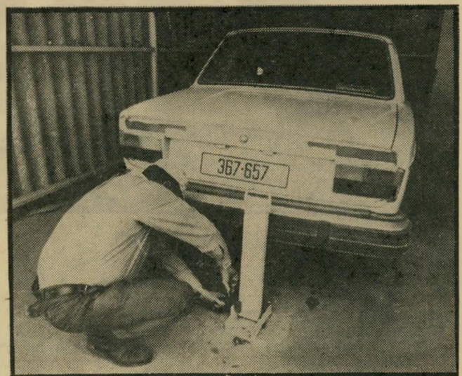
מיתקן לשמירה על מכונית במושב קידרון. הגנבים צוחקים מאיתנו!

שלמים לקום בשעה 5 בבוקר ולגלות שאתה לפתע מחוסר-כל. אין לך מקור פרנסה, שבו השקעת 30