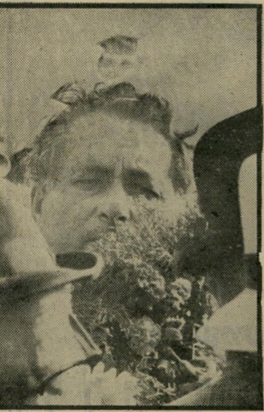
שמיר בהלוויית אצ"ג המפכה לא תהיה פה

הוא (במבט אבהי): "הסכת ושמע, אדון צעיר" (קטע ותופס בצווארו): "המחנק כבר מחזיק בגרונו. אנחנו מוכרחים להתכונן לכך סביב ממשלה לאומית. אתה חושב