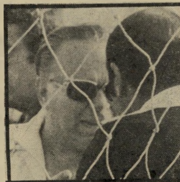
מאמן שוויצ'ר רבע מיליון לירות

הכדורגל מרכז סביבו סכומים אדירים של כסף. הפועל תל-אביב, למשל, תוציא סכום גדול עבור הזכייה באליפות. השח' קנים יקבלו מענקים של 200,000 לירות עד 500,000 לירות כל אחד. אלה הם מענקים מיוחדים עבור הזכייה באליפות. מלבד זאת יקבל כל אחד מהם סכום נוסף, של 40,000 לירות כל אחד, על-פי החוזה שלהם עם האגודה. החוזה מזכיר בעצם סכום של 18,000 לירות לכל שחקן, אבל אחרי המתנה ממושכת של 12 שנה