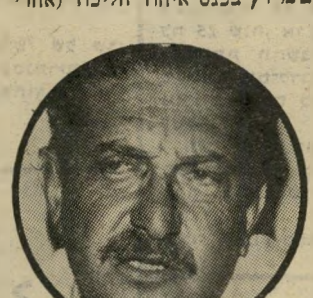
סופר וייצמן לא יודע לכתוב

על שריהחוק, יצחק שמיר, בכנס איחוד הליכוד (אחרי