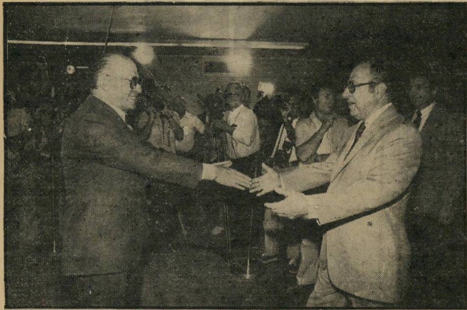
פיליפ חביב נציגו של הנשיא האמריקאי, רונלד רגן, שבא למסע דילוגים במזרח התיכון בגלל משבר הטילים, פגש בראשי-הממשלה מנחם בגין, כשמסביבם עיתונאים וצלמים מכל רחבי העולם. בפגישה הראשונה בין השניים נראה כאילו הם יוצאים בריקוד.