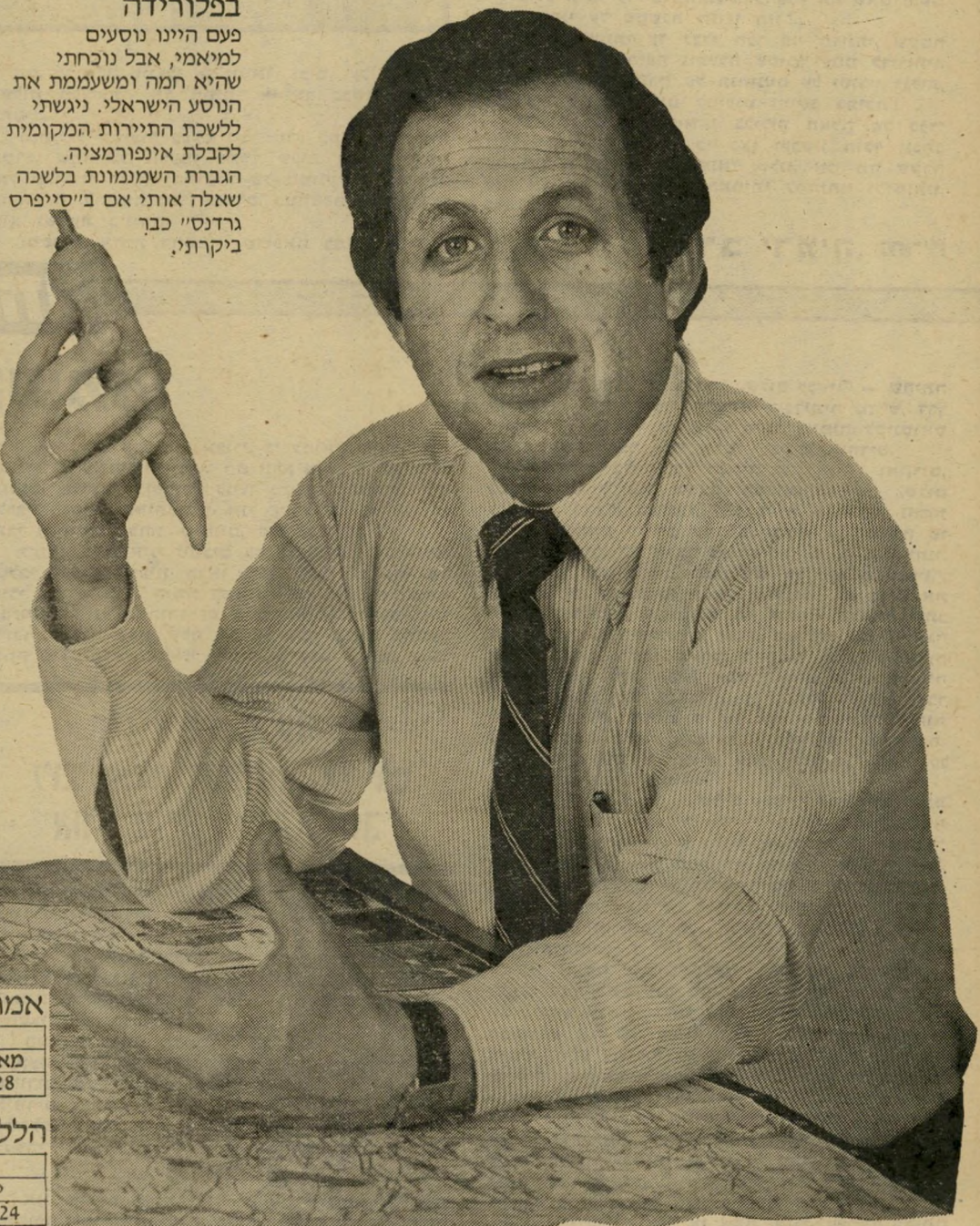
מוסיק בריקמן-מונ"ל בוא ניסע